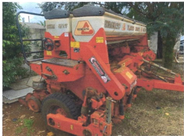
8.5. Foto 5