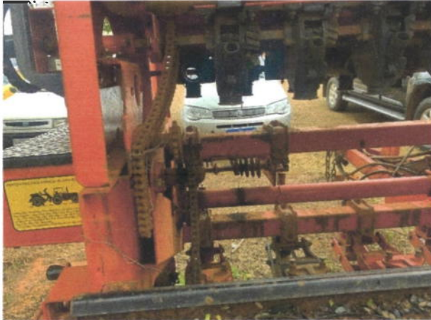
8.13. Foto 13