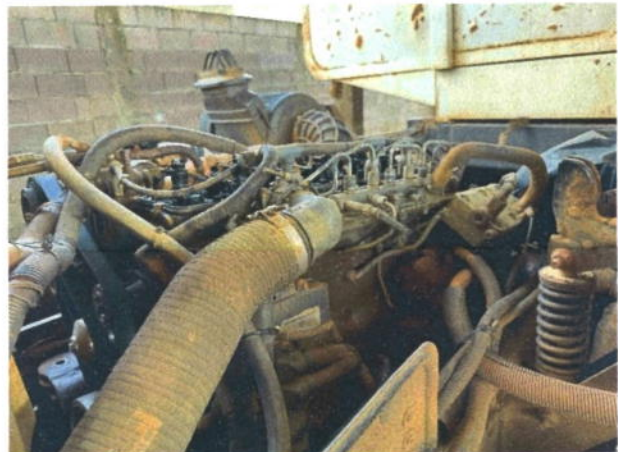
8.14. Foto 14